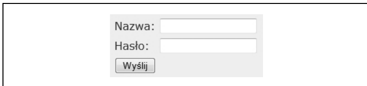
Rysunek 7.1. Strona facetów JSF wyświetlona w oknie przeglądarki internetowej

Powyższy kod wyświetla tabelę złożoną z dwóch wierszy i trzech kolumn (patrz rysunek 7.1).